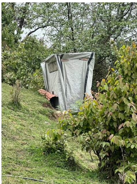
Exemple de WC locaux

Ainsi, l'absence de sanitaires ne relevait pas seulement d'un problème d'infrastructure : elle compromettait la santé publique, freinait l'accès à l'éducation et portait atteinte aux droits fondamentaux des enfants et des adolescents. Le projet de construction des toilettes apparaissait donc comme une condition indispensable pour offrir aux élèves un environnement digne, sûr et propice à l'apprentissage.